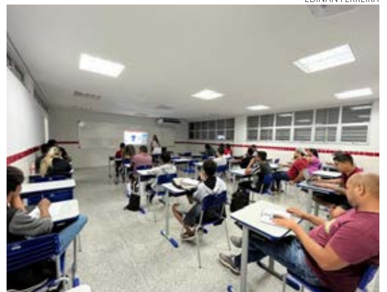
Inscrições para cursos gratuitos de capacitação das Escolas do Futuro de Goiás estão somente até esta segunda-feira

As unidades oferecem cursos de Robótica Educacional para Docentes, Manufatura auditiva com impressoras 3D, Redes de Computadores, Planejamento de Marketing, Impressão de Peças 3D, Sistemas de Computação, Lógica de Programação, Gestão Financeira, Inglês Instrumental, Impressão