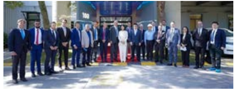
Comitiva goiana durante visita a empresa chinesa

ta, uma das maiores empresas de engenharia e infraestrutura do mundo, a China Railway Limited (CREC), confirmou o envio de uma missão à Goiás em 2024 para avaliar oportunidades no mercado local. A empresa poderá ajudar na construção de ferrovias e minérios e já tem atuação na Mina Boa Vista, em Catalão, e em outros estados brasileiros.