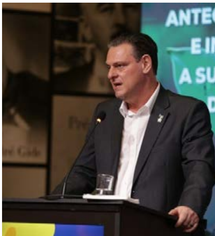
No Encafé, ministro Fávaro defende competitividade do café brasileiro

O ministro ainda falou da importância em evidenciar o produto brasileiro para que cada vez