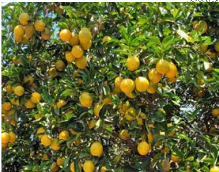
Goiás ocupa a 8ª posição em produção de citros no país

Até dezembro, 58 fiscais estaduais agropecuários vão percorrer 66 propriedades rurais comerciais e sete viveiros de mudas de citros nas principais regiões produtoras para realizar levantamento fitossanitário e levar orientações a produtores. O monitoramento teve início em outubro e ocorrerá em 43 municípios goianos.