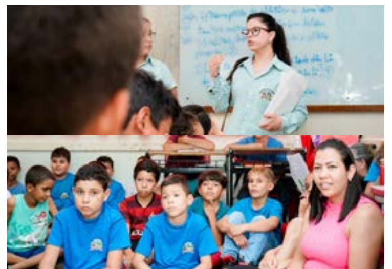
Servidores da Secretaria Municipal foram pessoalmente em cada unidade escolar com panfletos educativos e explicar como funcionará o concurso. A premiação será no dia 11 de dezembro

De acordo com a SEMMA, as premiações são uma forma de estimular a participação dos estudantes e das escolas. Sendo assim, a unidade educacional que mais coletar sementes ganhará um dia no Clube Eldorado. Já o estudante que mais se destacar nas turmas de pré-escola ano vai receber uma bicicleta aro 20; do 1º ao 5º ano, uma bicicleta aro 26; do 6º ao 9º ano, uma TV 32 polegadas e, no ensino médio, um celular.