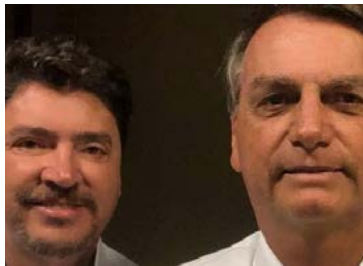
Wilder Moraes e Jair Bolsonaro: força ao PL de Goiás