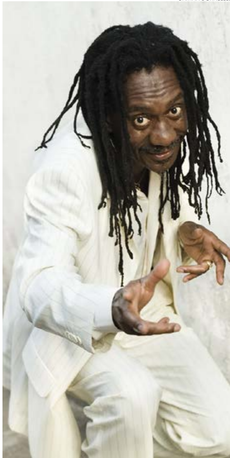
Pérola negra: Luiz Melodia transitou por diferentes estilos e linguagens

Melodia chega aos anos 1990 com o hit “Cara a cara”, parceria dele com o violonista Renato Piau. Foi lançado no CD “Pintando o Sete” (1991). Essa década foi produtiva: Melodia registrou mais três álbuns. O novo milênio começou com “Retrato do Artista Enquanto Coisa” (2001). “Estácio Vivo” é lançado numa boa hora. Gol de placa da Sony Music. Luiz Melodia é essencial, ainda mais no dia em que a sociedade reflete sobre a Consciência Negra.