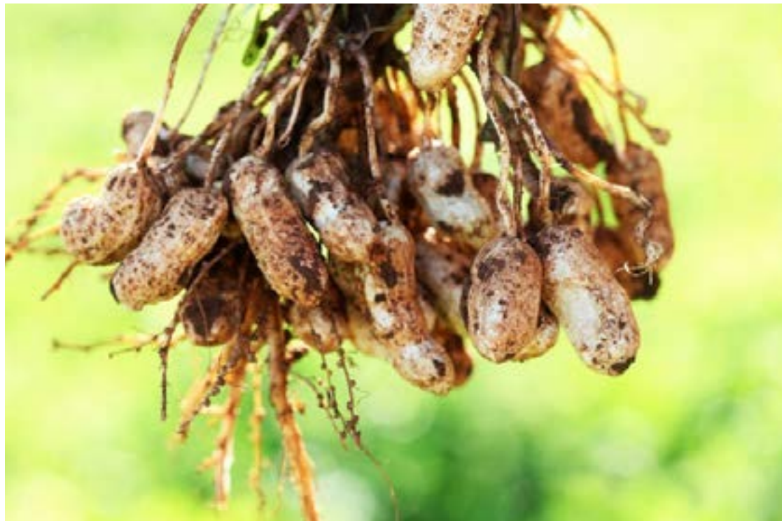
Valor Bruto da Produção atinge R$ 1,151 trilhão em 2023

Contribuições positivas estão sendo observadas em uma relação grande de produtos. São eles: amendoim com 17,6% de aumento real no VBP, arroz 17,8%, banana 15,9%, cacau 19,5%, cana de açúcar 17,2%, laranja 18,0%, mandioca 42,4%, soja 2,9%, tomate 23,0% e uva