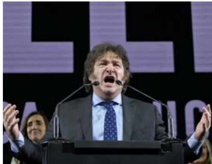
Javier Milei derrotou ontem Sérgio Massa: apuração definitiva só começará a ser feita 48h após fim das eleições

Com 86,59% das urnas computadas, a Direção Nacional Eleitoral da Argentina informou ontem às 21h30 a primeira parcial da apuração dos votos do segundo turno: Milei liderava com 56% e Massa tinha 44,04%.