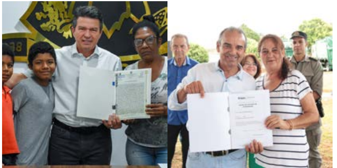
A entrega das escrituras aconteceu na quinta-feira (16) e sexta-feira (17).

Na última segunda-feira, 13, foram entregues outras 72 escrituras para moradores dos bairros Colmeia Park, Estrela