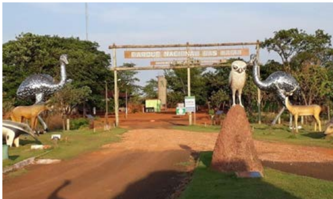
Cerradinho Bioenergia apoia evento esportivo no Parque Nacional das Emas, em Chapadão do Céu