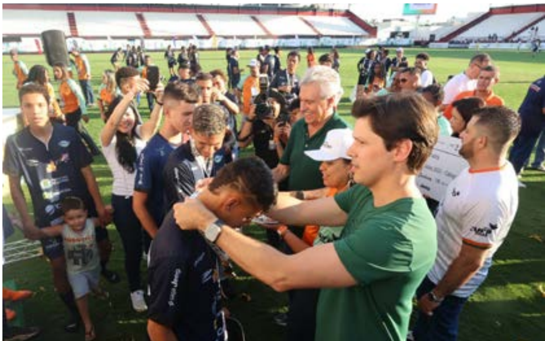
Ministro André Fufuca, governador Ronaldo Caiado e vice-governador Daniel Vilela nas finais da Taça das Favelas 2023

O time Orlando de Moraes, da capital, sagrou-se bicampeão vencendo por 4 a 1 a final contra o Quilombola Boa Nova (Professor Jamil). Na final feminina: as atletas do Gentil Meirelles, de Goiânia, venceram o time Monte Azul, de Senador Canedo, por 7 a 1.