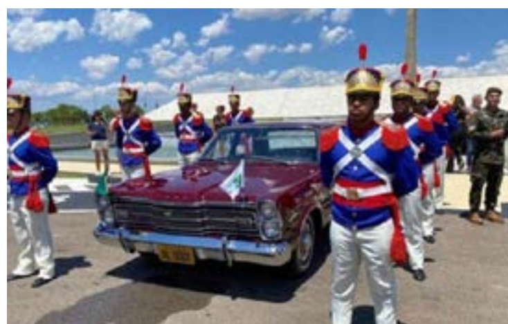
Ford Galaxie de Juscelino Kubitschek em frente ao Palácio do Planalto

O ex-governador do Distrito Federal e vice-presidente do Memorial JK, Paulo Octávio, afirma que os cochilos eram uma forma de o ex-presidente descansar durante as agendas. “O presidente Kubitschek não dirigia muito. Ele tinha um motorista, que era quem dirigia. Quando ele vinha para Brasília, dormia no banco de trás do carro, era muito confortável. Era um homem muito ativo e aproveitava uns momentos para tirar uma sonequinha. Era uma tradição dele”, contou.