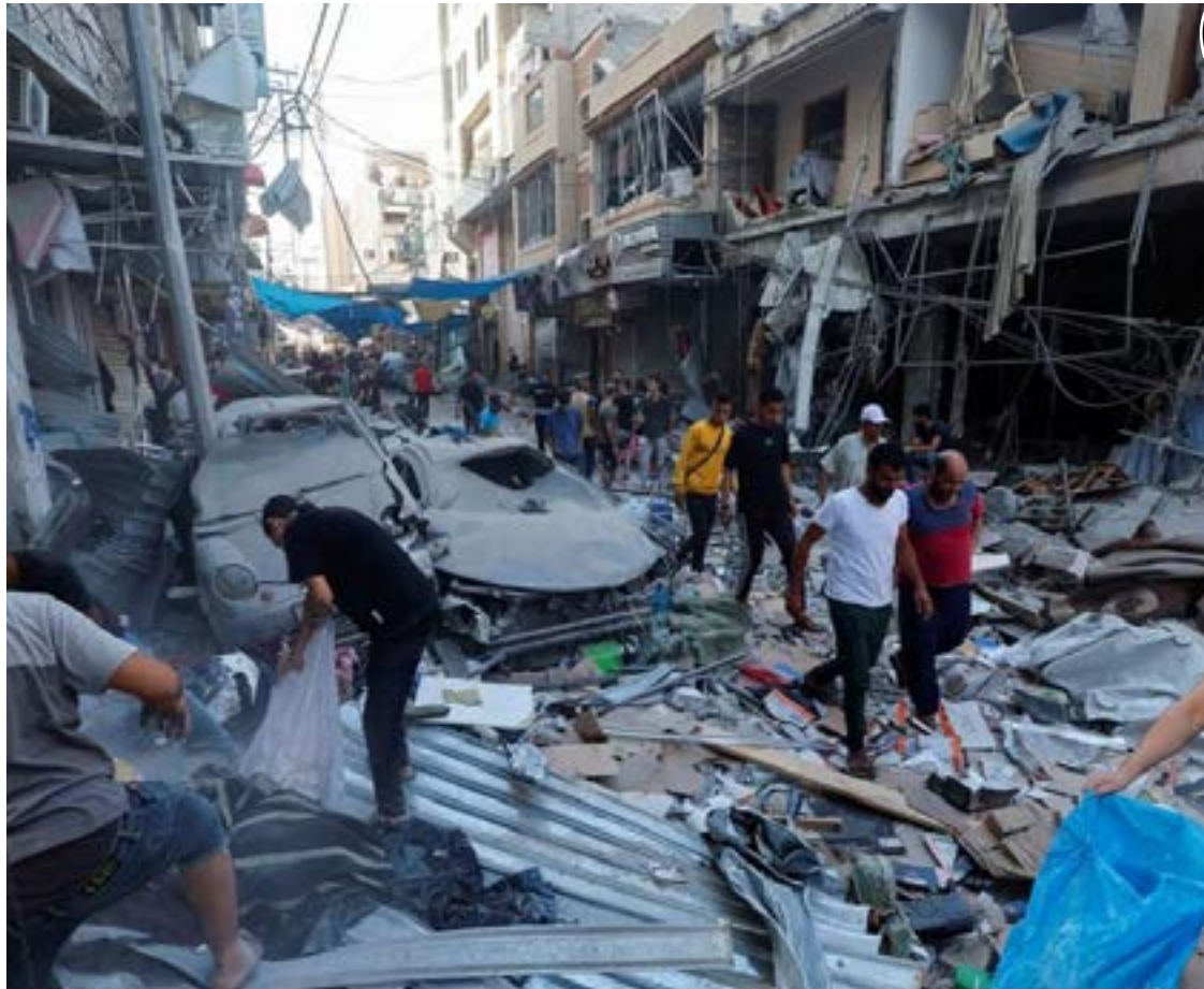
Palestinos procuram vítimas em local de ataque israelense, no sul da Faixa de Gaza

A rede de apoio iraniana, conhecida como “eixo de resistência”, inclui o Hezbollah no Líbano, o regime de Bashar al-Assad na Síria, os rebeldes houthis do Iêmen e milícias iraquianas apoiadas pelo Irã. Os iranianos também apoiam o Hamas e a Jihad Islâmica em Gaza. Essa guerra em Gaza aumenta o risco de conflitos envolvendo os dois polos geopolíticos, com tensões crescentes na fronteira entre Israel e Líbano, e ataques dos houthis e mi-