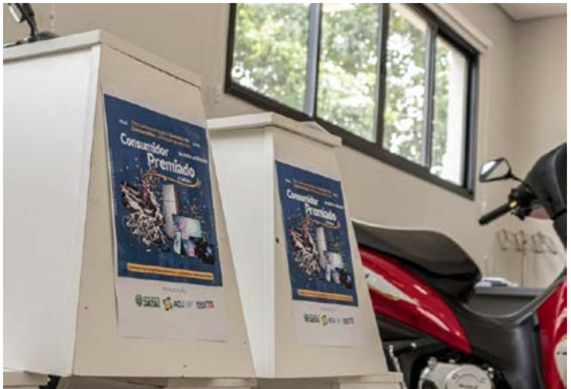
O sorteio acontecerá no dia 16 de março de 2024

Todas as empresas participantes receberão os cupons para distribuir aos consumidores até o dia 16 de março, data do sorteio. A campanha conta com diversos parceiros, incluindo a Associação Comercial-Industrial de Jataí (ACIJ).