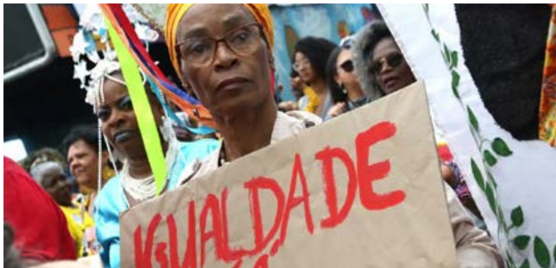
Estudo constata que mulheres negras recebem menos da metade do que homens brancos e amarelos

A alta letalidade das operações policiais nas periferias e crimes contra lideranças negras pelo país é outro motivo de